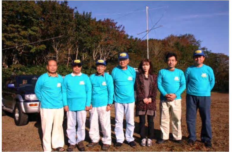
つと楽な環境をとと思います。

蟹でした。参加各局大感激! どうも有難うございました。次回の参加は、移動地を少し考えなくてはいいかなとも考えます。もう少し近場にして参加し易くして気温等も